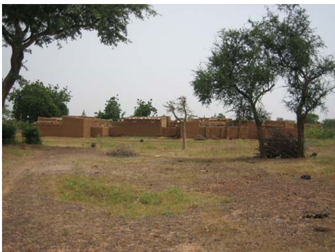
Ein Dorfteil von Tangaye