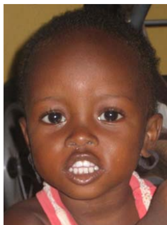
Kalizeta, 2 Jahre