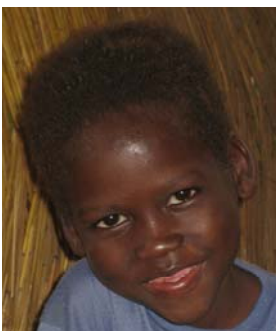
Boureïma , 6 Jh.