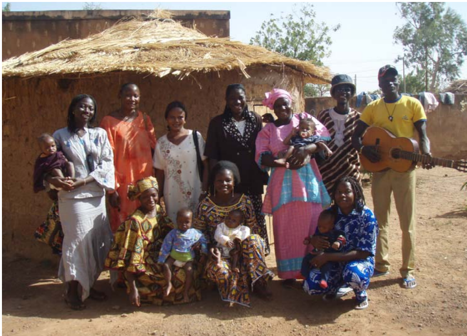
Das Team der L'Île du Bonheur, Stand Februar 2008.