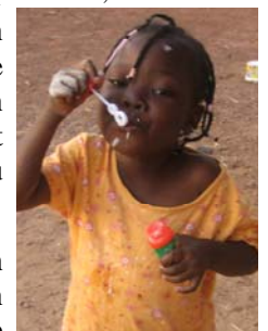
Adama, Feb 08