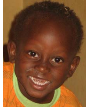
Hamadé, 5 Jh.