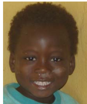
Fatao, 4 Jh.