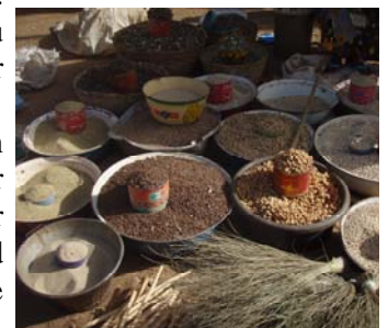
Hirse, Bohnen u.a. auf dem lokalen Markt