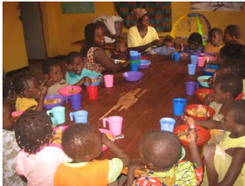
Am Mittagstisch, Februar 08

Es ist schon ein Jahr her, dass unser Waisenhaus L'Île du Bonheur seine Türen eröffnet hat, am 15. Januar 2007...Kaum zu glauben, wie schnell diese 12 Monate vergangen sind...!