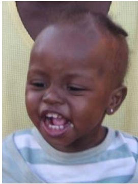
Kalizeta, 14 Mo.