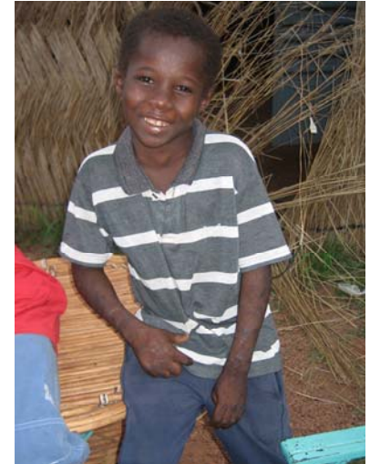
Issa, November 07

sich in der Lage, ihn bei sich aufzunehmen. In ihrer Verzweiflung erkundigte sie sich nach dem nächstgelegenen Waisenhaus in