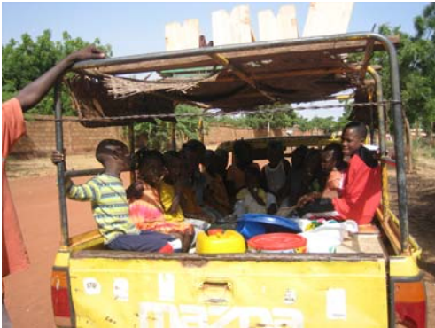
Ausflug ins Grüne, Oktober 07