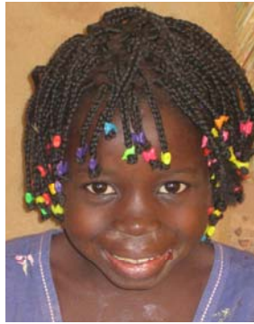
Balguissa, 6 Jh.