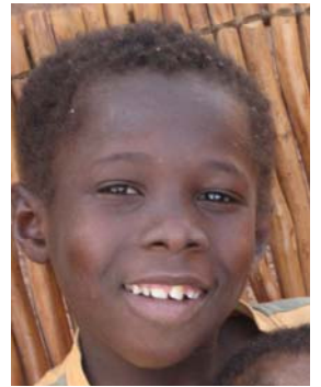
Issa, 8 Jh.