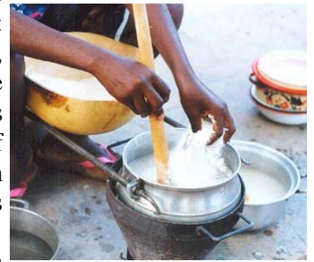
die Zubereitung von "Tô"

In Burkina Faso, einem der ärmsten Länder der Welt, schwanken die Ernährungsmöglichkeiten je nach Saison sehr stark. Jedes Jahr muss die ländliche Bevölkerung, welche sich hauptsächlich aus den Produkten der Landwirtschaft ernährt, eine „magere“ Periode durchmachen, „période de soudure“ genannt (Konsolidierungs-Periode). Diese erstreckt sich vom Zeitpunkt, wo die Getreide-Reserven aufgebraucht sind, bis zum Zeitpunkt der nächsten Ernte, nach der Regenzeit, also von Mai bis September . Diese Zeit ist sehr schwierig zu überstehen und die Nahrungsmittel auf dem Markt sind sehr teuer.