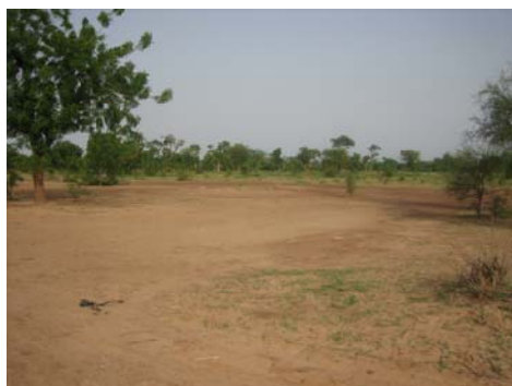
Unser neues Grundstück an bester Lage!