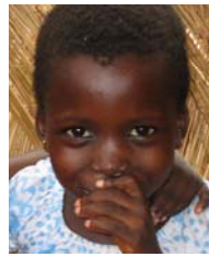
Balguissa, 6 J.