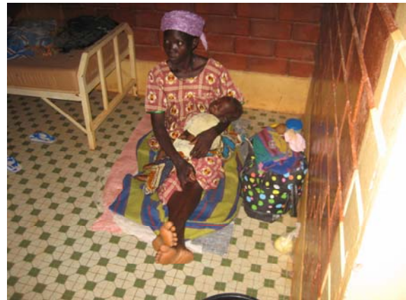
Malariabehandlungszimmer (September 2006, Kinderspital von Dr. Zala in Ouahigouya)

Malaria ist nicht nur eine leise, sondern auch eine extrem schwer greifbare Katastrophe. Die ganze Misere wird durch die chronisch mangelhafte Gesundheitsversorgung in Entwicklungsländern noch verschlimmert. Es gibt kaum Labors, die eine Malaria-Infektion feststellen können. Eine an Malaria erkrankte Person braucht eine rasche medizinische Versorgung, wobei in ländlichen Gebieten Afrikas diese Hilfe häufig entweder gar nicht oder zu spät kommt. Leider haben die Plasmodien gegen den über Jahrzehnte bewährten, billigen Wirkstoff Chloroquin Resistenzen gebildet. Medikamente der neueren Generation sind verhältnismässig sehr teuer und für die meisten Patienten unerschwinglich! Diese Krankheit kostet nicht nur Leben, sondern verursacht dem afrikanischen Kontinent einen Verlust potentieller wirtschaftlicher Aktivität von über 12 Milliarden US-Dollar jährlich, da durch die Krankheit viele Kinder dem Unterricht fernbleiben müssen und viele Erwachsene ihrer beruflichen Tätigkeit nicht mehr nachgehen können. Was unter anderem ein hemmender Faktor für eine nachhaltige Entwicklung des Kontinentes ist.