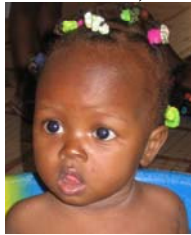
Kalizeta, 9 Mo.