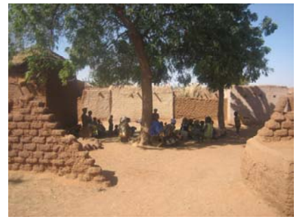
Versammlung der Dorfbewohner unter dem grossen Baum in Fatao's Dorf

Uebrigens: Fatao würde sich über eine liebe Patin, einen lieben Paten oder eine liebe Patenfamilie sehr freuen!