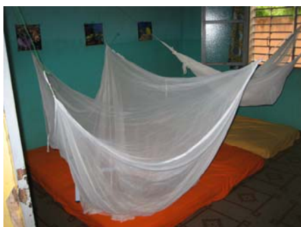
Das "frischbenetzte" Schlafzimmer der Jungs

So startet meine erste Woche im Waisenhaus ziemlich hektisch und mit grossen Sorgen! Denn auch im Waisenhaus