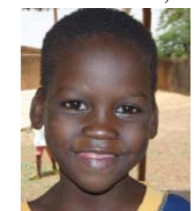
Boureïma, 6 J.