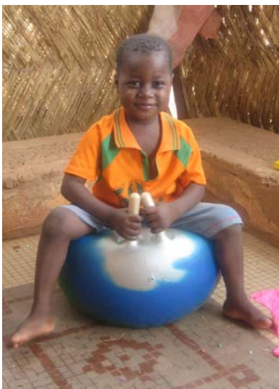
Fatao im Juli 07