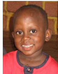
Hamadé, 4 J.