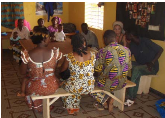
Teamsitzung, Juli 07

Nebenbei gibt es in dieser Woche natürlich noch viel Organisatorisches und Administratives zu erledigen... Die Menüpläne müssen überdacht werden, denn wenige Monate vor der Ernte werden frisches Obst und Gemüse auf dem Markt immer seltener und die Preise steigen gewaltig an. Orangen findet man nur selten und Bananen sind fast unbezahlbar. Dafür sind die aus dem Süden importierten Mangos in der Regenzeit süsser und saftiger denn je und man kann sie fast überall kaufen. Die Kinder lieben sie und ausserdem ist diese Frucht überaus vitaminreich. Auch müssen wir mehrere Teamsitzungen durchführen, Arbeitspläne und Arbeitszeiten neu gestalten, da zwei unserer Betreuerinnen von einer 50%-Anstellung auf 100% gewechselt haben.