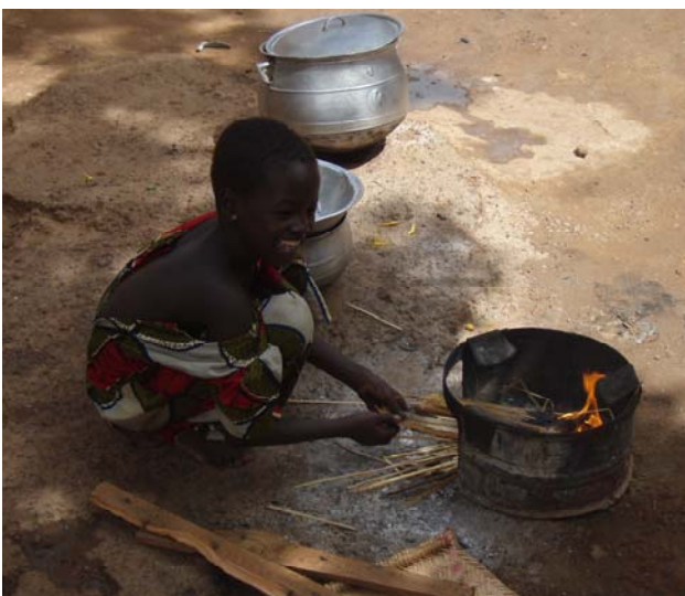
Fatou beim Anfeuern

brauchen werden. Also bleibt die traditionelle Kochstelle. Trotzdem möchten wir den inneren Teil so erneuern, dass er gut als Abstell- und Arbeitsfläche genutzt werden kann und dem hygienischen Standard entspricht. Was uns trotz einfacher Mittel ziemlich gut gelingt. Mit neuer Farbe, dem