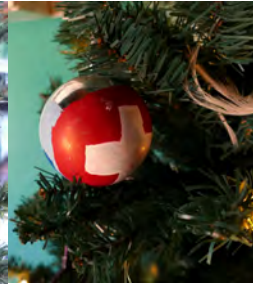
Die selbstbemalten Christbaumkugeln und Kerzenhalter