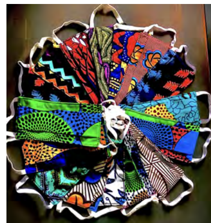
Schutzmasken vom P3-Projekt in Ouahigouya hergestellt

am Beispiel von Frankreich und die Maskenpflicht wurde sehr schnell eingeführt. Zu diesem Zeitpunkt war dies in der Schweiz noch gar kein Thema. Der Mangel an medizinischen Schutzmasken wurde rasch kompensiert. Die Lösung war, diese aus Stoffresten selbst zu nähen oder nähen zu lassen. Da sich in Burkina Faso die meisten Leute ihre Kleidungsstücke beim Schneider massangefertigt herstellen lassen und den Rest vom Stoff danach wieder nach Hause nehmen, hatten viele noch Stoff übrig, mit dem sie zu jedem Outfit eine passende Maske nähen konnten. Das Tragen von Kopfschmuck (Kopftuch, Turban) mit dem gleichen Stoff wie die Maske wurde zu einem