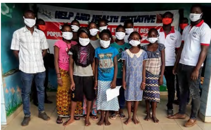
Covid-19-Präventionskampagne auf L'Île du Bonheur

mal so schlecht ist. Die vielen Maskenkreationen wurden in kürzester Zeit zu einem Verkaufsschlager, dessen Varianten so bunt sind wie der Kontinent selbst. Maske tragen war plötzlich «cool und trendy». Das Desinfektionsmittel hingegen war von Anfang an Mangelware. Einige Soldaten wurden extra dafür ausgebildet, selber Desinfektionsmittel herzustellen, um ihr Wissen danach der Bevölkerung weitergeben zu können. Medizinstudenten starteten diverse Covid-19-Sensibilisations- und Präventionskampagnen im ganzen Land. Sie kamen sogar zweimal zu uns ins Waisenhaus, um das Personal und die älteren Kinder zu schulen. Der Erfindungsgeist und die souveräne Art, mit dieser neuen Situation umzugehen, die Burkinabè an den Tag gelegt haben, ist beeindruckend. Dafür, dass es das siebtärmste Land der Welt ist, haben sie sich ausserordentlich gut geschlagen. Chapeau! Schade nur, dass es nicht für alle Bereiche so einfach funktioniert.