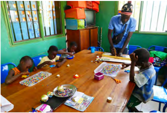
Das traditionelle Weihnachtsdeko-Basteln im Atelier von L'Île du Bonheur