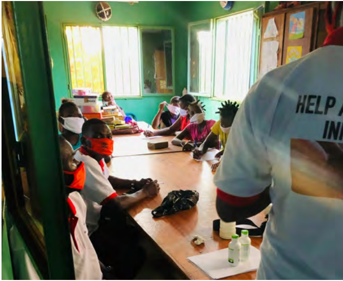
Covid-19-Kurse im Atelier von L'Île du Bonheur

Als Frankreich in den Lockdown ging, verordnete dies die burkinische Regierung ebenfalls. In Ouahigouya wurde, wie im ganzen Land, der „grand marché“, also der grosse Markt, von einem Tag auf den anderen geschlossen. Kindergärten, Schulen und Universitäten ebenfalls. Aber nach 24 Stunden mussten die Märkte notfallmässig wieder geöffnet werden, weil Chaos und Panik ausgebrochen waren. Ohne die entsprechende Logistik und die Möglichkeit, online zu bestellen (die meisten Menschen in Burkina Faso haben weder Internet noch eine Postadresse), war eine Schliessung von Märkten, wovon die Lebensmittelversorgung und die Lebensgrundlage (Kleinhändler) so vieler Menschen abhängen, nicht durchführbar. Der Flughafen jedoch blieb für kommerzielle Flüge während fast 5 Monaten komplett dicht. Keine Fluggesellschaft flog mehr von und nach Burkina Faso, ausser weniger Repatriierungsflüge und Warentransporte. Die Grenzen zu den Nachbarländern blieben ebenfalls zu.